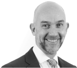
Adrian Crompton Archwilydd Cyffredinol Cymru a Phrif Weithredwr